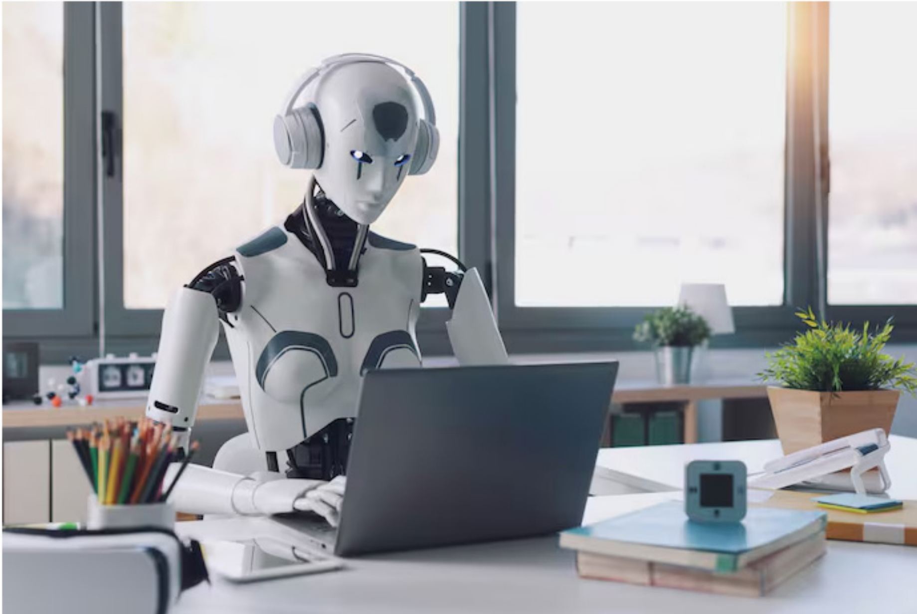
▲ Het AI-model moet snellere en betaalbaardere diagnoses en behandelingen mogelijk maken.