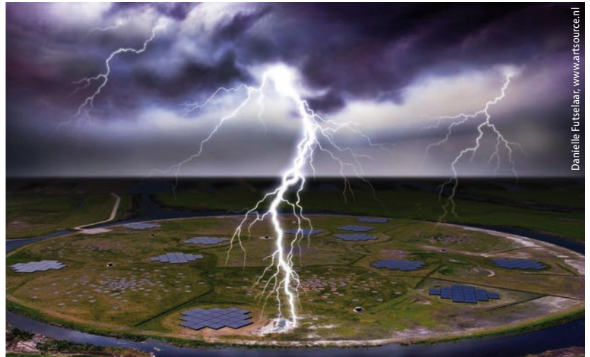
Künstlerische Darstellung eines Blitzes über der Zentralstation des Radioteleskops LOFAR (LOW Frequency ARray) im Nordosten der Niederlande.

Mit dem Radioteleskop LOFAR (LOW Frequency ARray) konnte ein internationales Forscherteam neue unerwartete Strukturen in Gewitterwolken beobachten [1]. Dabei handelt es sich um pulsierende „Nadeln“ von 10 bis 100 Metern Länge, die sich aus positiven Entladungskanälen entwickeln. Dass sich diese Strukturen erst jetzt nachweisen ließen, beruht auf der höheren raum-zeitlichen Genauigkeit von LOFAR im Vergleich zu den weniger aufwändigen, dafür aber häufig transportablen LMAs. LOFAR beobachtet als Radioteleskop normalerweise relativ langsame bis statische Prozesse. Die deutlich schnellere Entladungsdynamik ließ sich nur mit einer neuen Software verarbeiten. LOFAR besteht aus sehr vielen Radioempfängern, deren Daten in einem Supercomputer in Groningen zusammengeführt werden. Die Empfänger sind in Gruppen angeordnet und bilden ein Interferometer, das sich von den Niederlanden aus über Europa erstreckt. Im Wesentlichen bestimmt die Genauigkeit des Zeit-