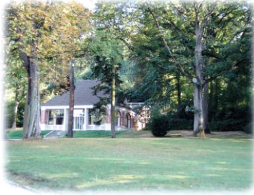
Eén van de gebouwen op de campus van het IHÉS (2006)