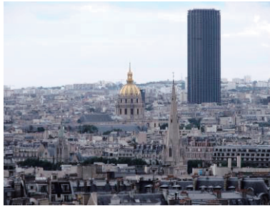
Dôme des Invalides met le Tour Montparnasse (2006)