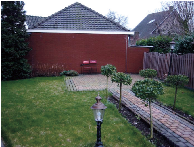
Amsterdamse humor: stoeltjes met 'Amstel Bier' logo in de tuin (2004)