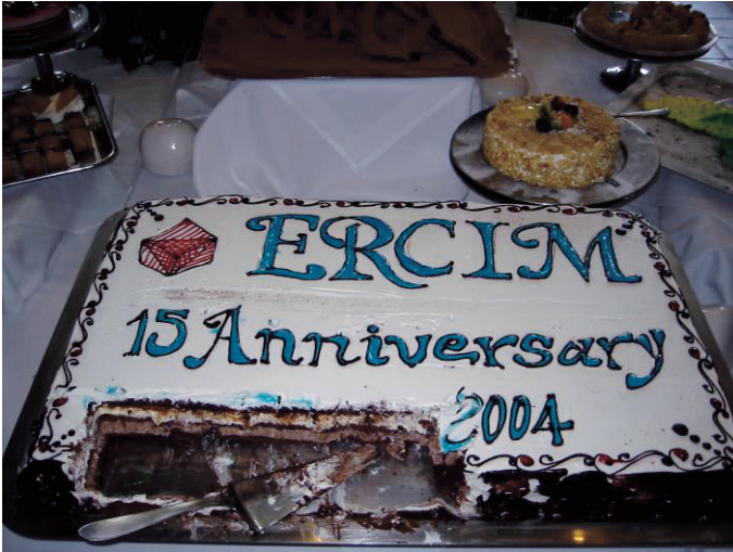
Er is er één jarig, hoera, hoera...(2004)