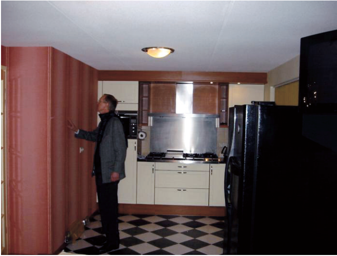
Meten is weten (2004)