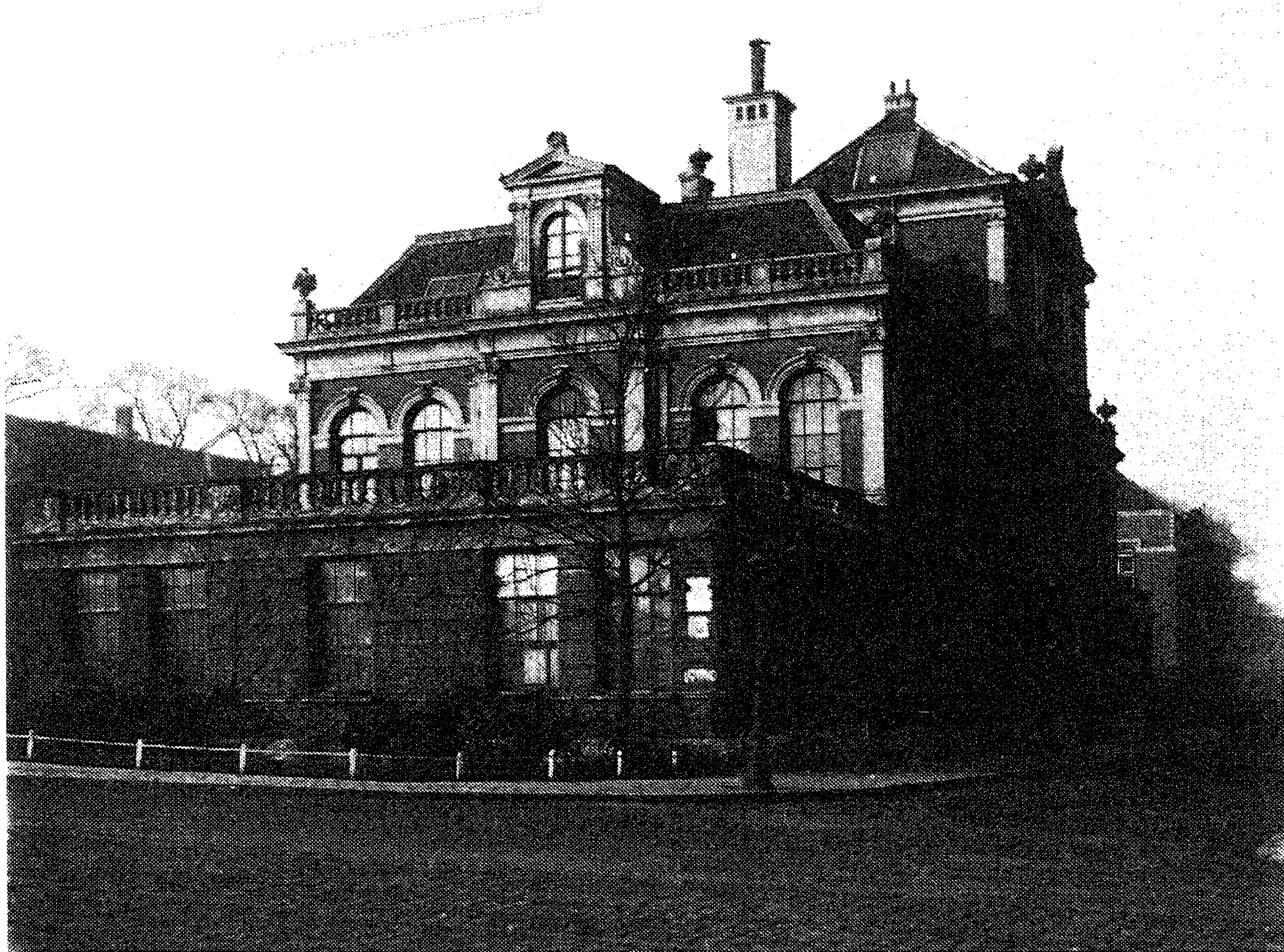
Het Natuurkundig Laboratorium van Clay aan de Plantage Muidergracht. In een kamertje aan de voorzijde van het gebouw zou in 1947 het 'Lab', de rekenmachinewerkplaats van het MC, gevestigd worden.

Brouwer wordt omzichtig behandeld. Immers, Van der Corput treedt wel op als de leidende figuur in wiskundig Nederland, Brouwer is met afstand de meest vooraanstaande en invloedrijke wiskundige. Met deze man, die zo notoir grillig is in het bestuurlijke en persoonlijke vlak, heeft de commissie dan ook terdege rekening te houden. Bovendien, zo iemand zou geweldig veel betekenen voor het aanzien van het instituut. Hij is aanvankelijk bereidwillig in de veronderstelling dat hij, als vanzelfsprekend, de leiding over het instituut zal krijgen. Als blijkt dat men hem wil omzeilen - het erevoorzitterschap van het Curatorium wordt hem aangeboden - komt het nooit meer helemaal goed. In de samenstelling van de commissie is een voorwaarde geschapen voor een machtsgreep, die wat het MC betreft slaagt. Brouwer heeft geen invloed gehad op de verdere ontwikkelingsgang van het instituut. Overigens wordt de correspondentie tussen Brouwer en Van der Corput gekenmerkt door een blijvend collegiaal respect. 43