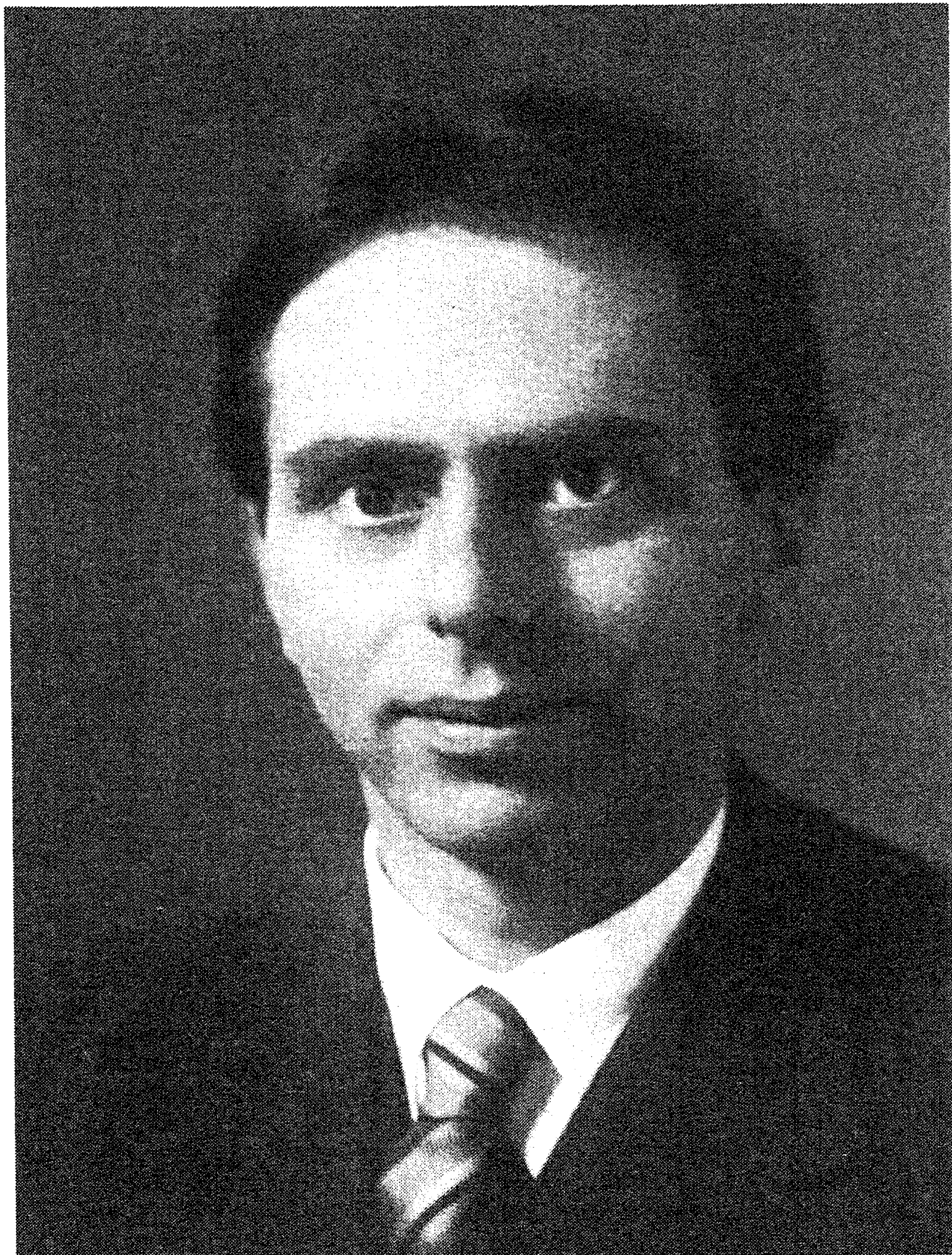
D. van Dantzig in 1938, de tijd van zijn 'flitsenhypothese'.

“Te fascinerend is de persoonlijkheid van deze man en de tijd waarin hij leefde, dan dat ik aan de verleiding weerstand had kunnen bieden, ver af te dwalen van het uitgangspunt”.